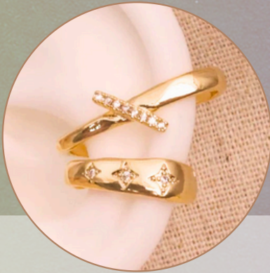
Earcuff. [EF10] Baño en rodio (Color dorado y piedras brillantes) Producto hecho a mano 100% colombiano.