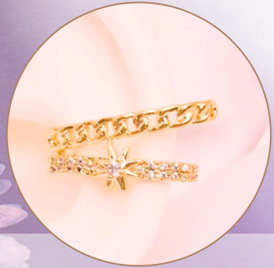
Earcuff. [EF9] Baño en rodio (Color dorado y piedras brillantes) Producto hecho a mano 100% colombiano.