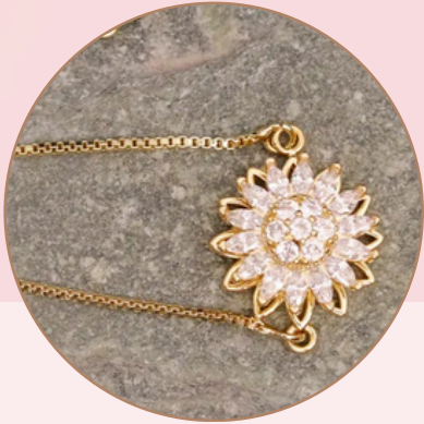
Manilla con Dije Anti-Estrés. [PR3] (giratorio), con Baño en Rodio.