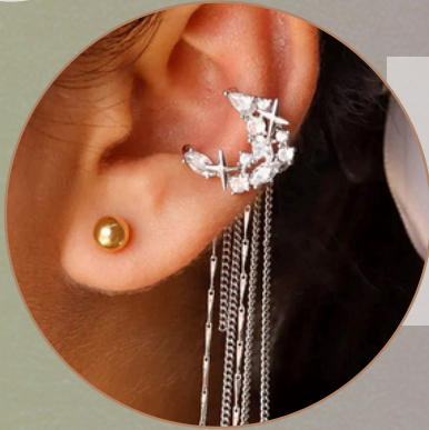
Earcuff. [EF8] Earcuff con baño en Niquel. (Color plata y piedras) Producto hecho a mano 100% colombiano.