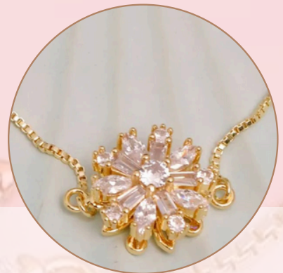
Manilla con Dije Anti-Estrés. [PR7] (giratorio), con Baño en Rodio.