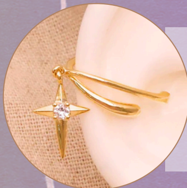
Earcuff. [EF14] Baño en rodio. (Color dorado y piedras brillantes) Producto hecho a mano 100% colombiano.