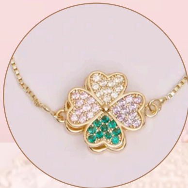
Manilla con Dije Anti-Estrés [PR6] (giratorio), con Baño en Rodio.