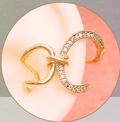
Earcuff. [EF12] Baño en rodio. (Color dorado y piedras brillantes) Producto hecho a mano 100% colombiano.