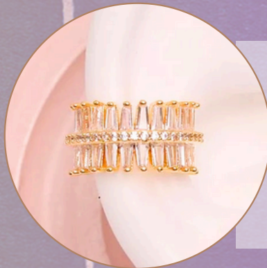
Earcuff. [EF13] Baño en rodio. (Colores dorado, plata y piedras brillantes) Producto hecho a mano 100% colombiano.