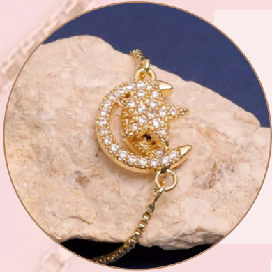
Manilla con Dije Anti-Estrés. [PR1] (giratorio), con Baño en Rodio.