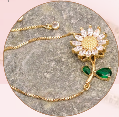
Manilla con Dije Anti-Estrés. [PR2] (giratorio), con Baño en Rodio.