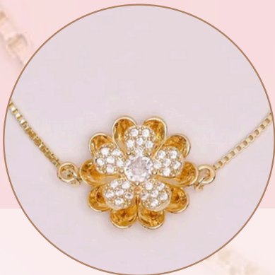
Manilla con Dije Anti-Estrés. [PR5] (giratorio), con Baño en Rodio.